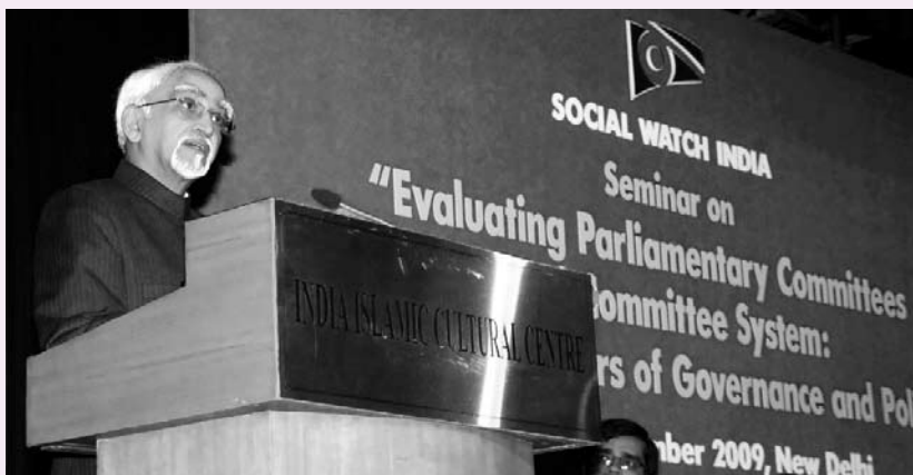
El vicepresidente de India, Hamid Ansari, durante la inauguración del seminario "Evaluación de comités y el sistema de comités: modificando contornos de gobernanza y políticas", organizado por la Coalición de Social Watch en India, en noviembre de 2009.

y regionales en los que las organizaciones que forman parte de la red aportan la visión local, informando sobre el estado de situación en sus países en relación al tema específico de cada año.