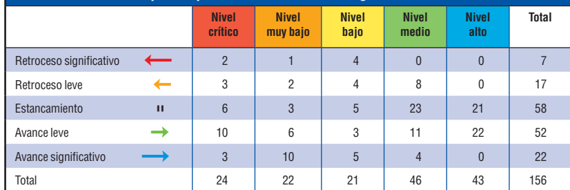
TABLA 3. Variación porcentual del ICB por regiones