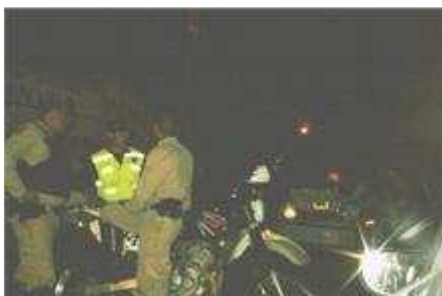
Policía de Mérida en el lugar donde se estrelló el taxi.