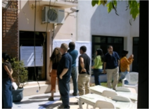
Las dinámicas dentro del curso: el bulevar de los DDHH