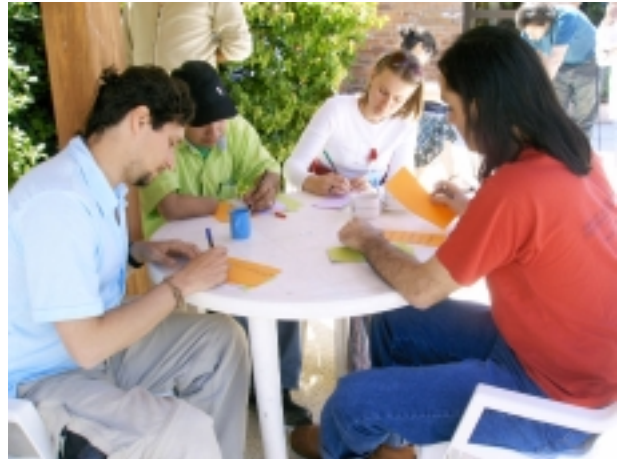
Las dinámicas dentro del curso: preparando la línea de los DDHH