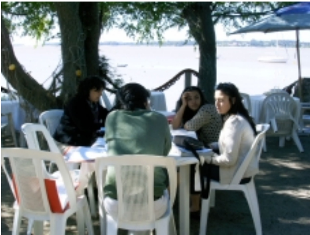
En Colonia, reunión de facilitadores.