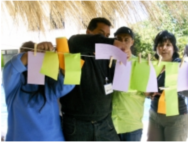
Las dinámicas dentro del curso: preparando la línea de los DDHH