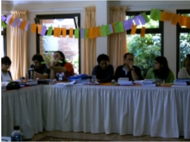
Las dinámicas dentro del curso: la jerga de los DDHH