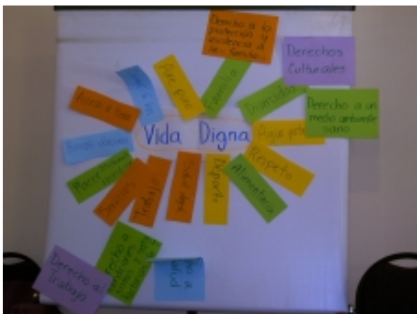
Las dinámicas dentro del curso: definiciones de vida digna