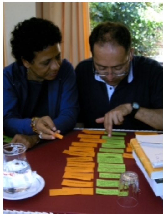
Las dinámicas dentro del curso: la jerga de los DDHH