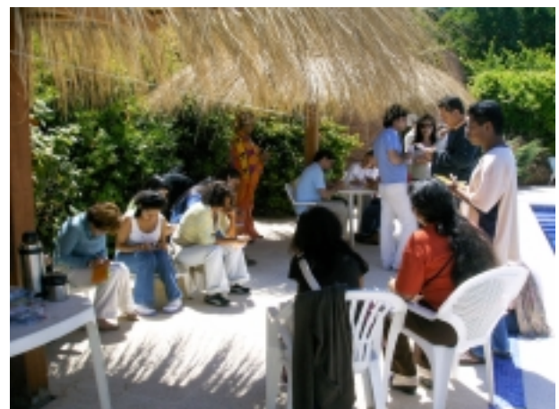
Las dinámicas dentro del curso: preparando la línea de los DDHH