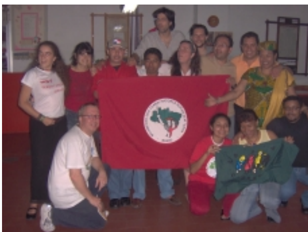
Parte del grupo en la cena final.