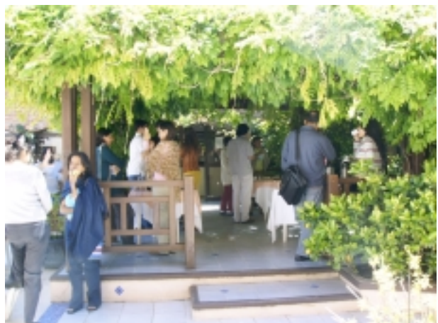
Coffee break como espacio de confraternización.