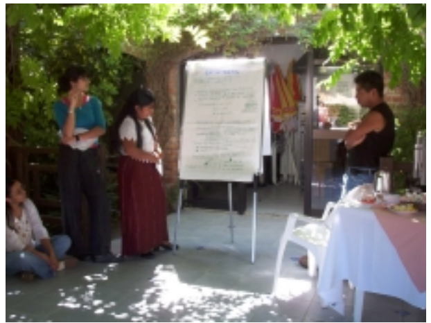
La presentación de los casos de estudio