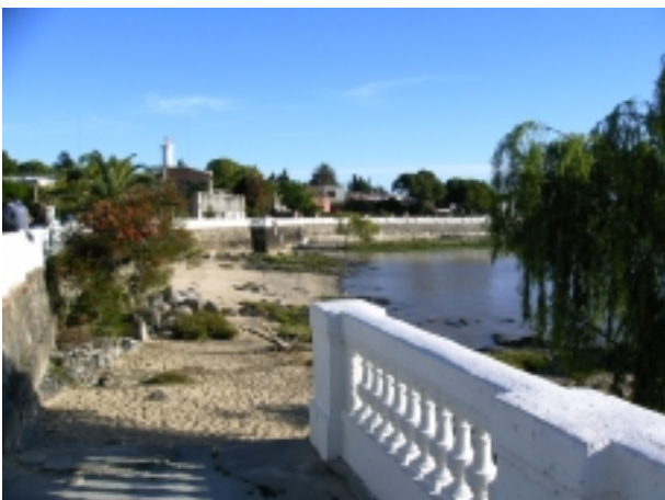
La costa de la Ciudad de Colonia del Sacramento.