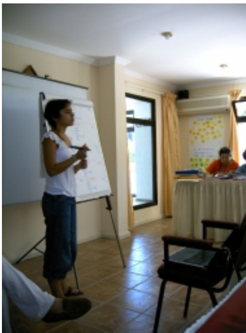
Las dinámicas dentro del curso: presentando una sesión