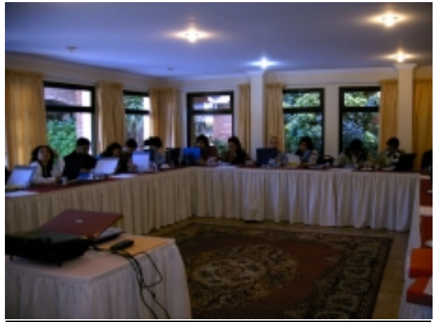
Finalmente todo el grupo junto.