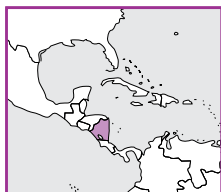
Coordiadora Civil Adolfo Acevedo

Nikaragujský vzdělávací systém je poměrně zpátečnický, a to nejen pokud jde o pokrytí, ale i z hlediska kvality. Jen 86 % dětí ve školním věku skutečně nastoupí na základní školu a jen 40 % z těch, kteří nastoupí do první třídy, se dostanou do šestého ročníku. 2 Pouhých 45 % mladých lidí nastupuje na střední školu a jen 44 % z těch, kteří ji začnou studovat, ji úspěšně dokončí. 3 Když vezmeme v úvahu, že ukončené středoškolské vzdělání je minimální podmínkou k tomu, aby člověk začal stoupat nad hranici chudoby, existuje jen jediný možný závěr: Nikaragua své občany nepřipravuje na takový život, jaký by měli mít.